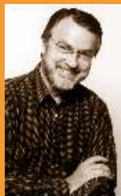
Dr. Harville Hendrix